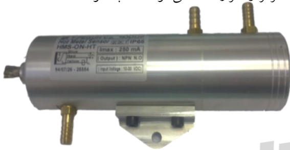
کیس اصلی با قابلیت خنک کاری با هوای فشرده

این سنسور امواج مادون قرمز منتشر شده از مواد داغ مانند شیشه، فولاد، سرامیک، و... را آشکار کرده و آنرا به سیگنال الکتریکی تبدیل می کند. این سنسورها قابلیت تنظیم میزان حساسیت برای شدت نور مادون قرمز را دارا می باشند (برای دسترسی به پیچ تنظیم باید گلند پشت سنسور را باز کرد) و با توجه به اینکه میدان دید نسبتاً باریکی بوسیله ابزارهای اپتیکی برای آن پیش بینی شده است، بنابراین توانایی بسیار بالایی برای سنسور فراهم شده است که می تواند موقعیت جسم داغ را بصورت دقیق تشخیص دهد. این سنسور از فاصله ۱ متر تا ۴ متر از جسم با توجه به شدت نور مادون قرمز و حرارت آن می تواند نصب شود.